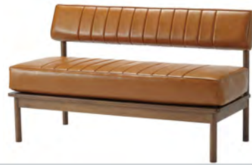
DUO ベンチ W1200×D650×H715 SH400mm ¥59,800 (税別)