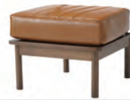
DUO オットマン W510×D470×H400mm ¥24,800 (税別)