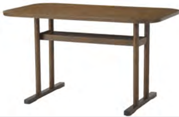
DUO LD テーブル W1200×D700×H660mm ¥44,800 (税別)