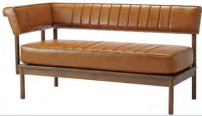
DUO カウチ R/L W1380×D650×H715 SH400mm ¥73,400 (税別)