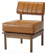
DUO 1P ソファ W510×D650×H715 SH400mm ¥32,800 (税別)