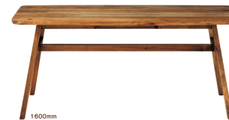
MINOテーブル 160 W1600×D800×H700mm:¥108,000