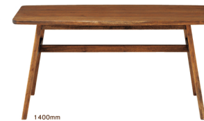
MINOテーブル 140 W1400×D800×H700mm:¥98,000

※MINOは日本製にこだわり、国内の工房で作られるノスタルジックファニチャーです。ご注文をいただいておりますので、お届けに約3週間程度かかる場合がございます。