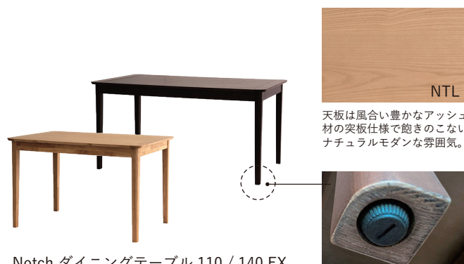
Notch ダイニングテーブル 110 / 140 EX NTL / BRN W1100 / 1500 D750 H700 mm W1400 / 1800 D800 H700 mm