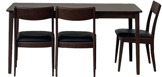
110EX テーブル (伸長時) + ローバックチェア BRN set