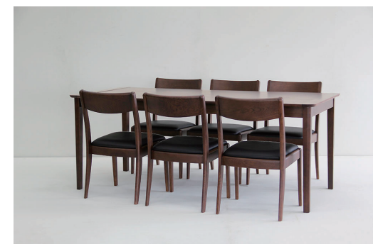
140EX テーブル (伸長時) + ローバックチェア BRN set