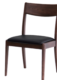
Notch ダイニングチェア ローバック NTL / BRN W465 D510 H760 SH430 mm