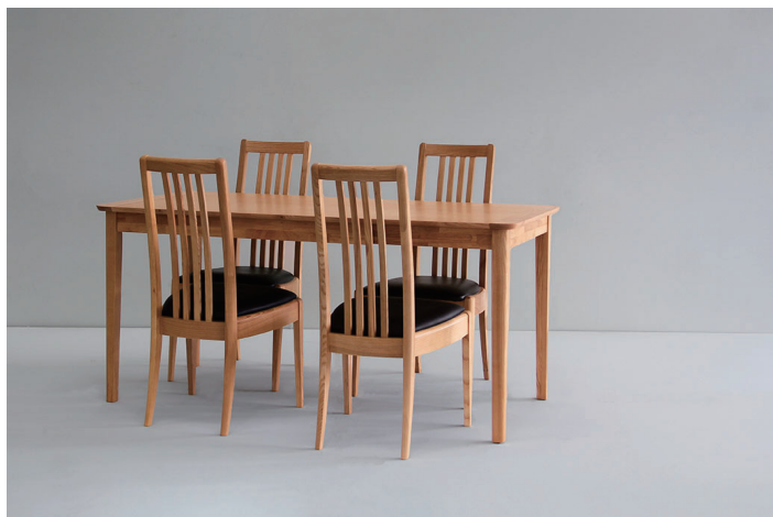
110EX テーブル (伸長時) + ハイバックチェア NTL set