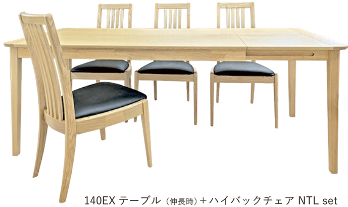
140EX テーブル (伸長時) + ハイバックチェア NTL set