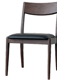
Notch ダイニングチェア ローバック NTL / BRN W470 D510 H760 SH420 mm