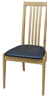
Notch ダイニングチェア ハイバック NTL / BRN W450 D550 H900 SH420 mm