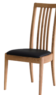
Notch ダイニングチェア ハイバック NTL / BRN W450 D545 H900 SH430 mm