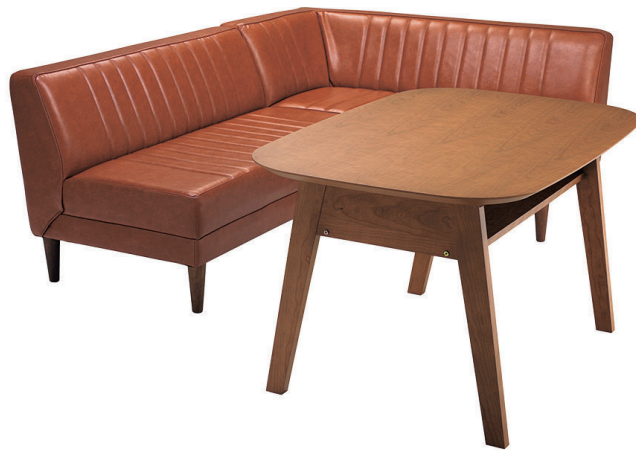
JAM-LD 3set (SOFA COLOR / BR) カウチ・ベンチ・LDテーブル

リビングやダイニングは、帰ってきた時にホッとできる場所であり、自然とみんなが集まる場所でありたい。その中心に、JAM-LDがある。古き良き時代のアメリカンダイナーを思わせるビンテージテイスト。その味わい深い雰囲気、家族や仲間が気構えずくつろげる、集いの場所となる。