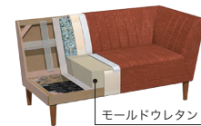
モールドウレタン