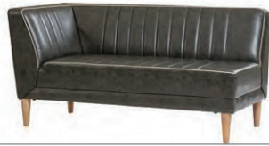
カウチR / L W1400×D700×H700 SH410 mm