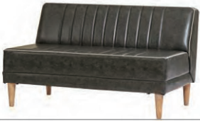
ベンチ W1200×D700×H700 SH410 mm